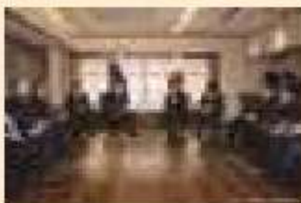
▲山口県長門市での会談

2013年(平成25年) 安倍総理の訪露 2016年(平成28年) 安倍総理のソチ非公式訪問 2016年(平成28年) プーチン大統領の訪日 2018年(平成30年) シンガポールでの首脳会談 2019年(令和元年) プーチン大統領の訪日