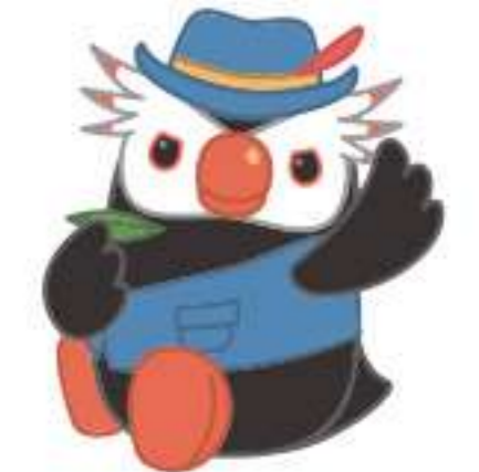
戦前の日本人より多くのロシア人が暮らしているピィ