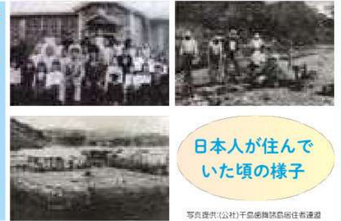
日本人が住んでいた頃の様子

(元島民の人数は、昭和20年8月15日現在において6月以上北方四島に居住していた者の数)