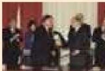
▲イルクーツク声明

2001年(平成13年) イルクーツク声明 2003年(平成15年) 日露行動計画