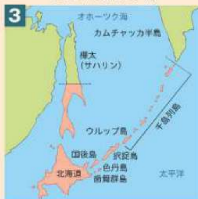
ポーツマス条約に基づく国境線 1905年（明治38年）