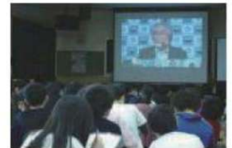
オンライン研究会