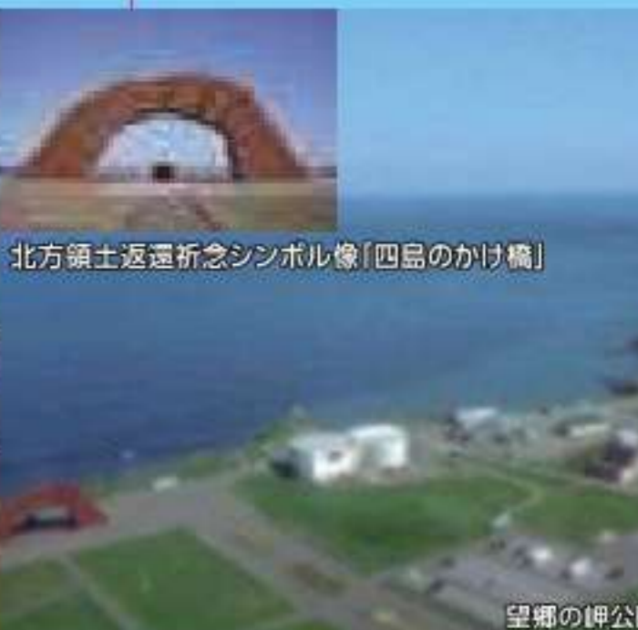
北方領土返還祈念シンボル橋「四島のかけ橋」

住所：北海道根室市納沙布36-6 TEL：0153-28-3277 ホームページ：https://www.hoppou.go.jp/activity/inform/facilities.html