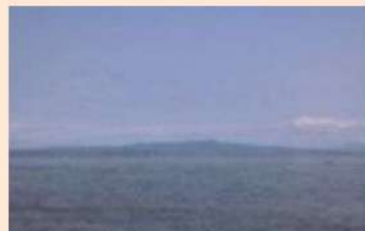
▲野付半島から眺めた国後島