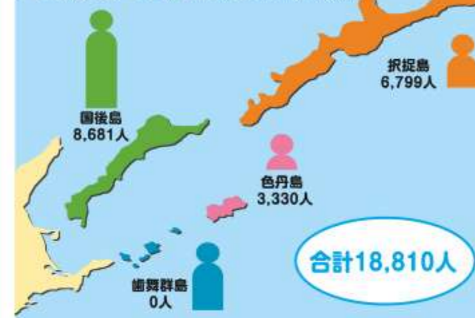
四島在住ロシア人(2021年1月1日現在)