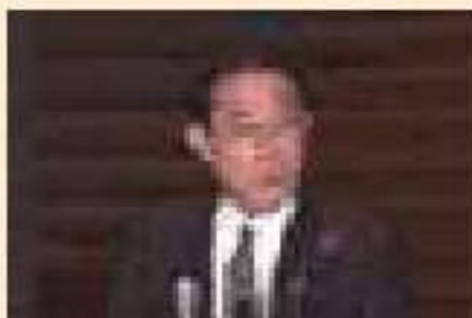
▲プーチン大統領との電話会談についての会見