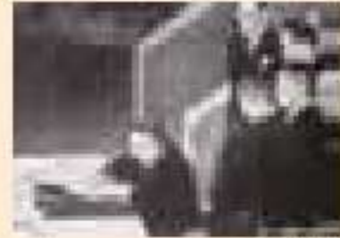
▲サンフランシスコ平和条約

1951年(昭和26年) サンフランシスコ平和条約 1956年(昭和31年) 日ソ共同宣言