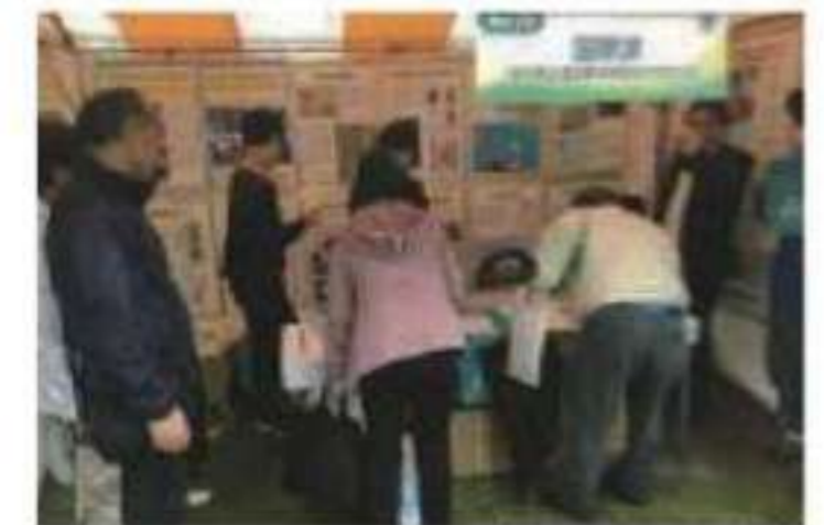
パネル展・署名活動

都道府県教育者会議は、社会科の教師を中心に社会科教育研究会会員、学校長、教育委員会等により構成され、北方領土授業の実践、作文コンクール、巡回パネル展、北方領土教材・資料の作成などを行っています。