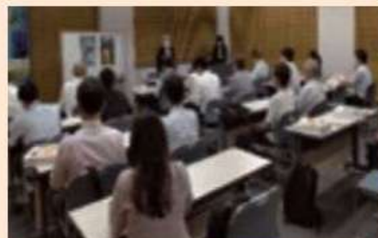
▲元島民の語り部による講演