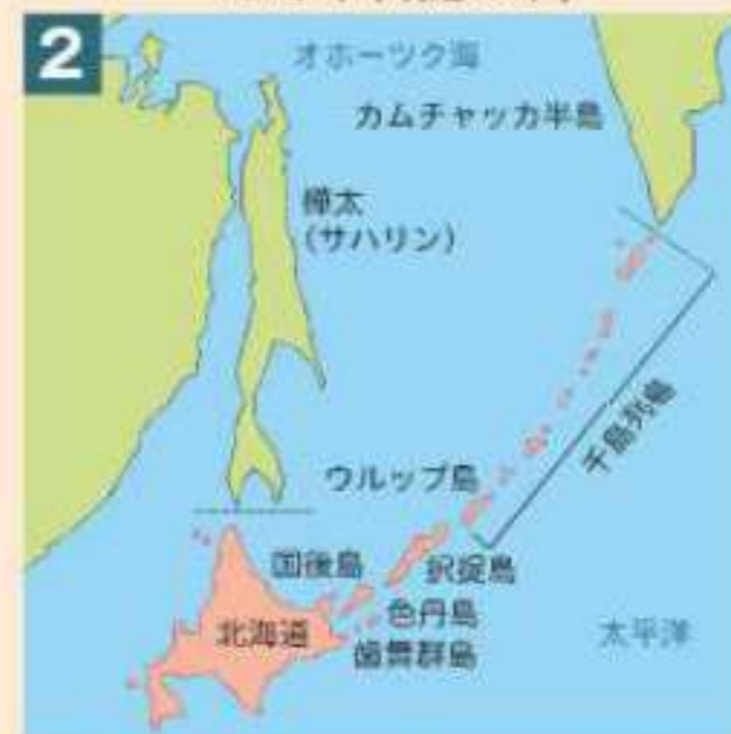
樺太千島交換条約に基づく国境線 1875年（明治8年）