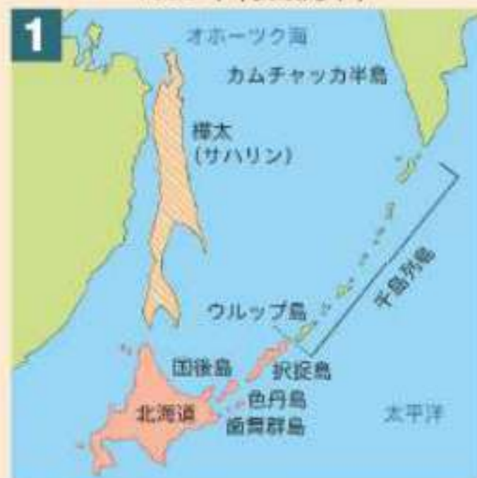
日露通好条約に基づく国境線 1855年（安政元年）