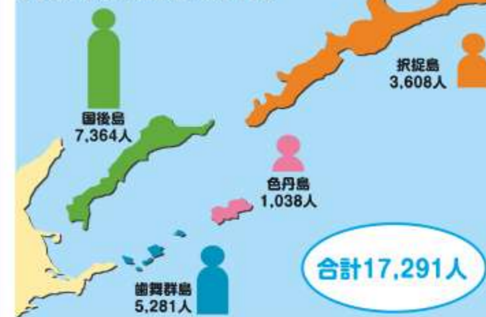
終戦時の元島民の人数

(元島民の人数は、昭和20年8月15日現在において6月以上北方四島に居住していた者の数)