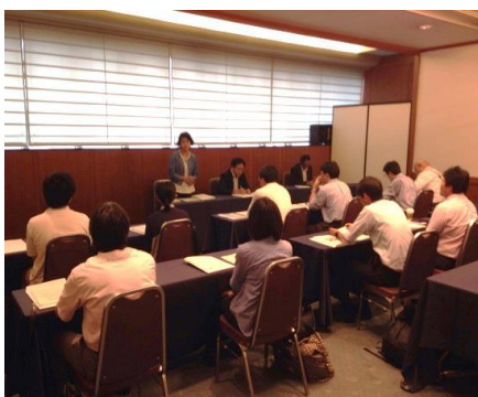
高岡座長による講話