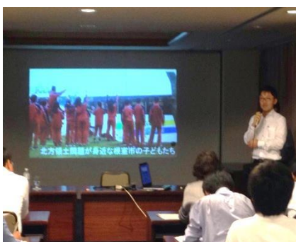
北川先生による学校での啓発